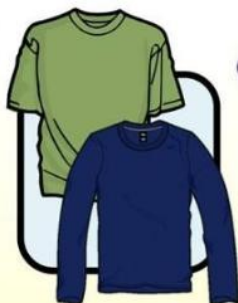
T-SHIRT OR LONG SLEEVES