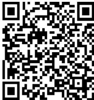
St. Joseph's Cathedral

Umat paroki juga boleh masukkan sumbangan mingguan mereka ke dalam Kotak Kutipan kayu besar yang diletakkan di pintu masuk Katedral ATAU lakukan pindahan dalam talian atau deposit tunai kepada Akaun Bank Katedral St. Joseph seperti berikut: