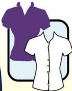
BLOUSE WITH SLEEVES