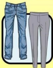
JEANS OR SLACKS