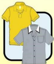
POLO SHIRT OR COLLARED SHIRT