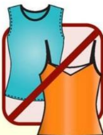
SLEEVELESS AND PLUNGING NECKLINES