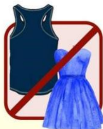
TUBES AND RACERBACKS