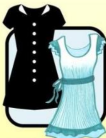
KNEE-LENGTH DRESS WITH SLEEVES