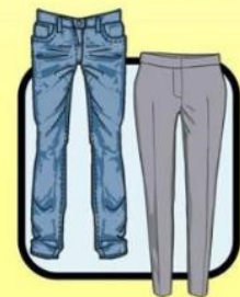
JEANS OR SLACKS