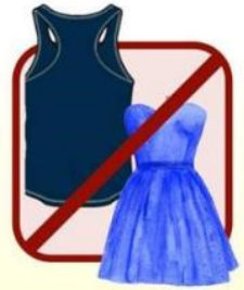
TUBES AND RACERBACKS