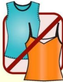
SLEEVELESS AND PLUNGING NECKLINES