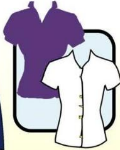
BLOUSE WITH SLEEVES