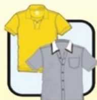
有领或端庄 整齐服饰