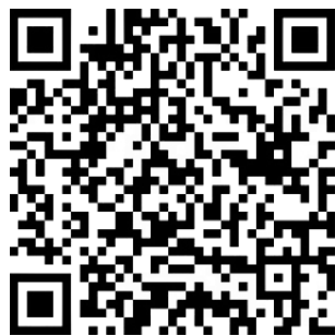
Catholic Welfare Services

为弱势群体捐款 - 请继续在经济上支持天主教福利机构，因为我们不分种族或信仰为在我们中的穷人和有需要的人服务。教友们可扫描此二维码以藉全球砂支付捐款给天主教福利机构。在确认交易之前，请确认收款者是 ‘ Catholic Welfare Services ’ (天主教福利机构)。教友们也可以在线转帐或现金存款致以下收款者：