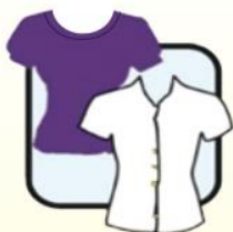
圆领/有领长袖或 短袖衬衫或T恤