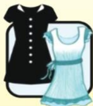
有袖连衣裙 (裙长过膝)