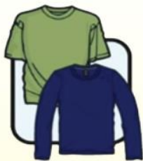
圆领长袖或 短袖衬衫或T恤