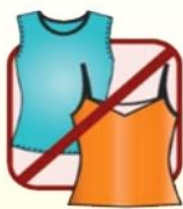
无袖/深V领口及 露肚装