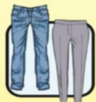
休闲长裤 或西装长裤