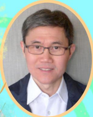
By Bryan Shen

[NOMINAL REGISTRATION FEE: RM50 PER HEAD TO COVER MEALS ]